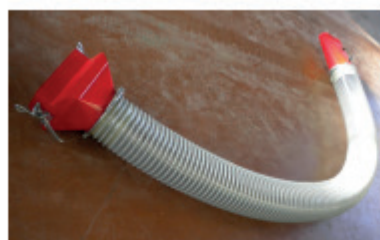
Rallonge manche a air