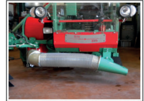
APPLICATION POUR VOIRIE