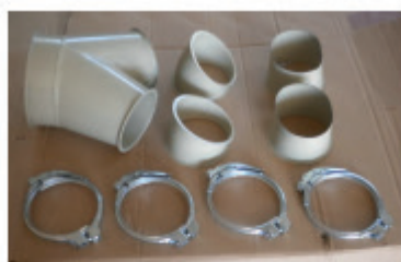
Divers coudes et colliers