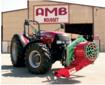
TURBINE T3P AVANT T3P0003