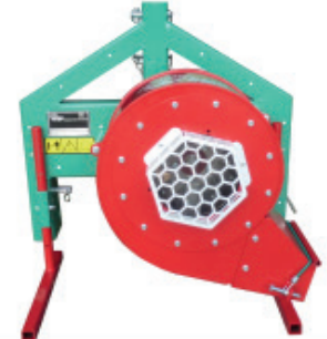
TURBINE T3P ARRIERE T3P0001