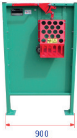
Standard cuillère carré 10 mm