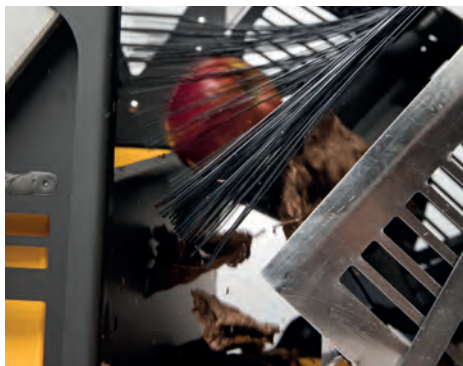
La brosse qui élimine les feuilles

Le système de pré-nettoyage breveté sépare les feuilles et l'herbe des fruits à l'aide d'une brosse. Les fruits et les noix ayant un poids plus important et une trajectoire différente, il permet à ceux-ci de passer à travers la brosse et de glisser directement dans la caisse. Les feuilles et l'herbe coupée, en revanche, restent collées et retombent sur la pelouse par la fente.