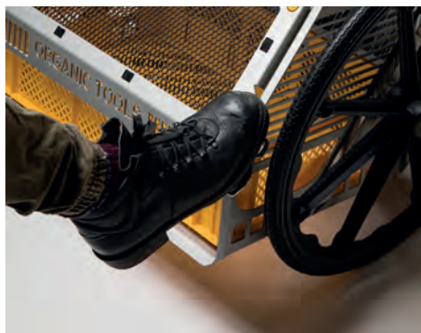
Changement de caisse pratique à l'aide d'une pédale