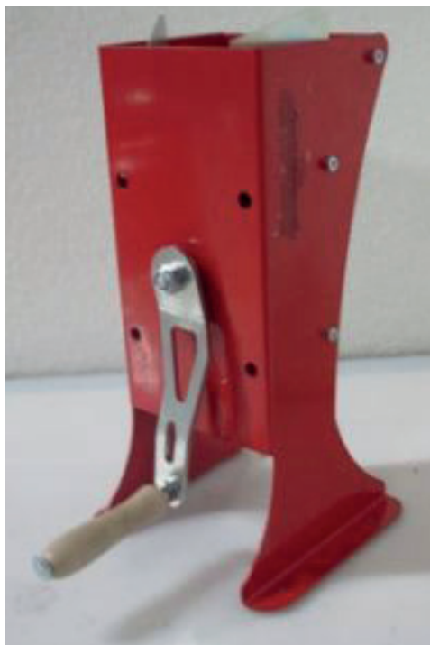
Casseuse SMALL 15 KG/H 7170046