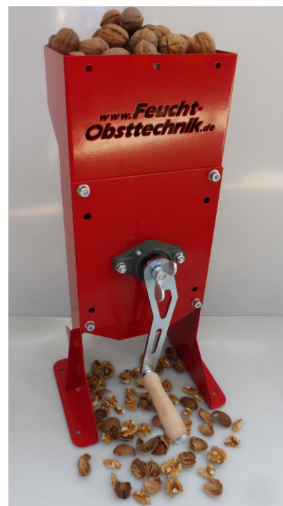
Casseuse 30 KG/H 7170047