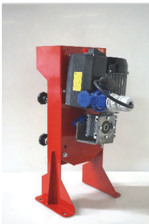
Casseuse MOTORISÉE 30 KG/H 7170049