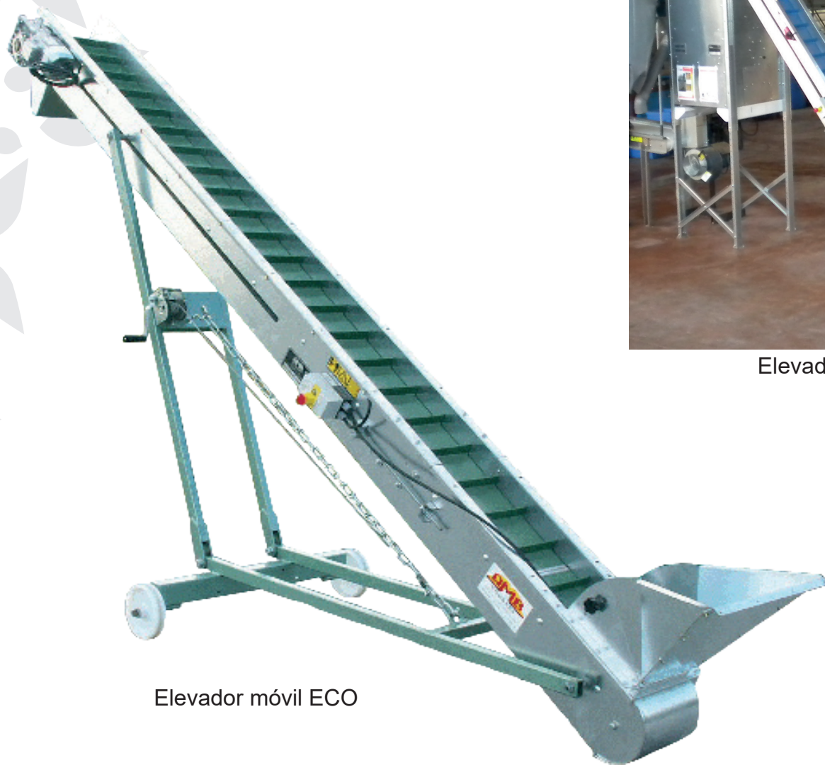
Elevador móvil ECO