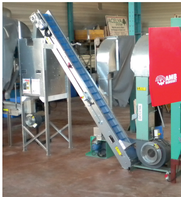
Elevador fijo ECO