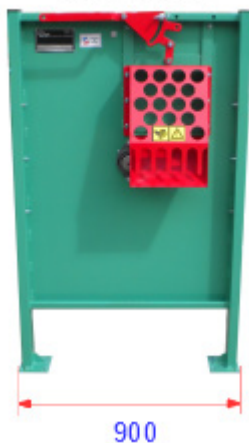
Standard cuillère carré 10 mm